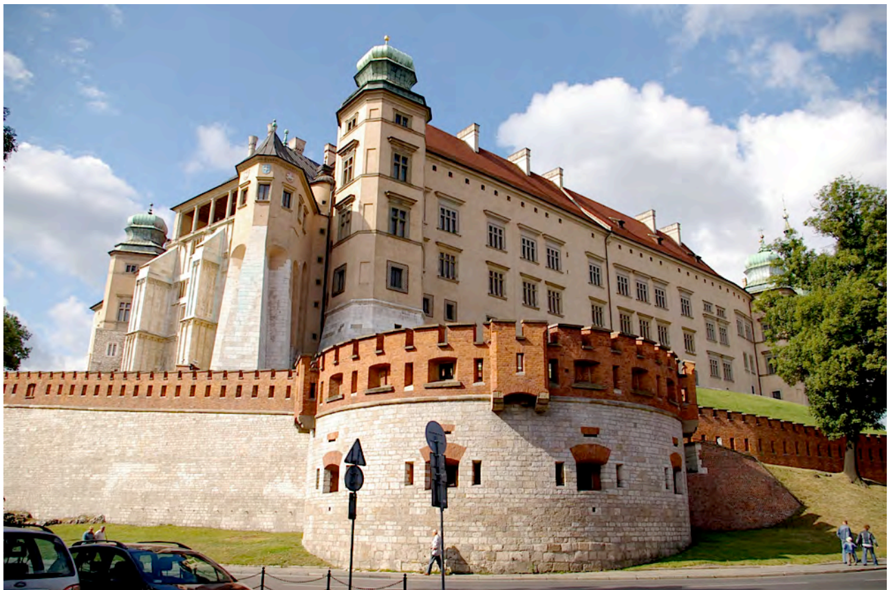
Le château du Wawel

Puis visite guidée de la Colline de Wawel avec le Château Royal de Wawel , siège des rois polonais jusqu'en 1609, la Cathédrale de Wawel , lieu de couronnement et d'enterrement des rois polonais et le musée de la Cathédrale , qui présente des souvenirs du maréchal Poniatowski. Vue de la sépulture du maréchal Poniatowski.