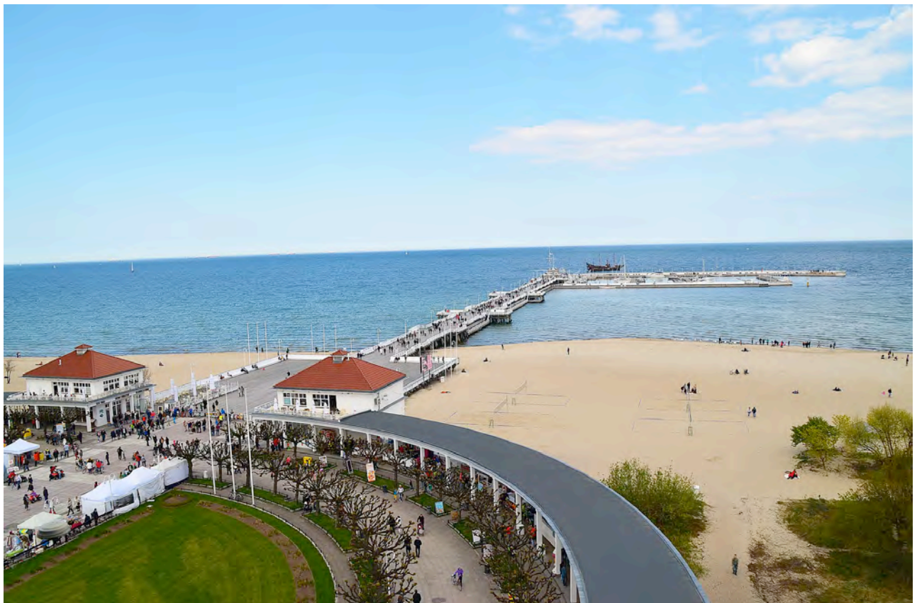
Sopot et sa célèbre jetée sur la Baltique

Nuit à l'hôtel 4* Golden Tulip Residence .