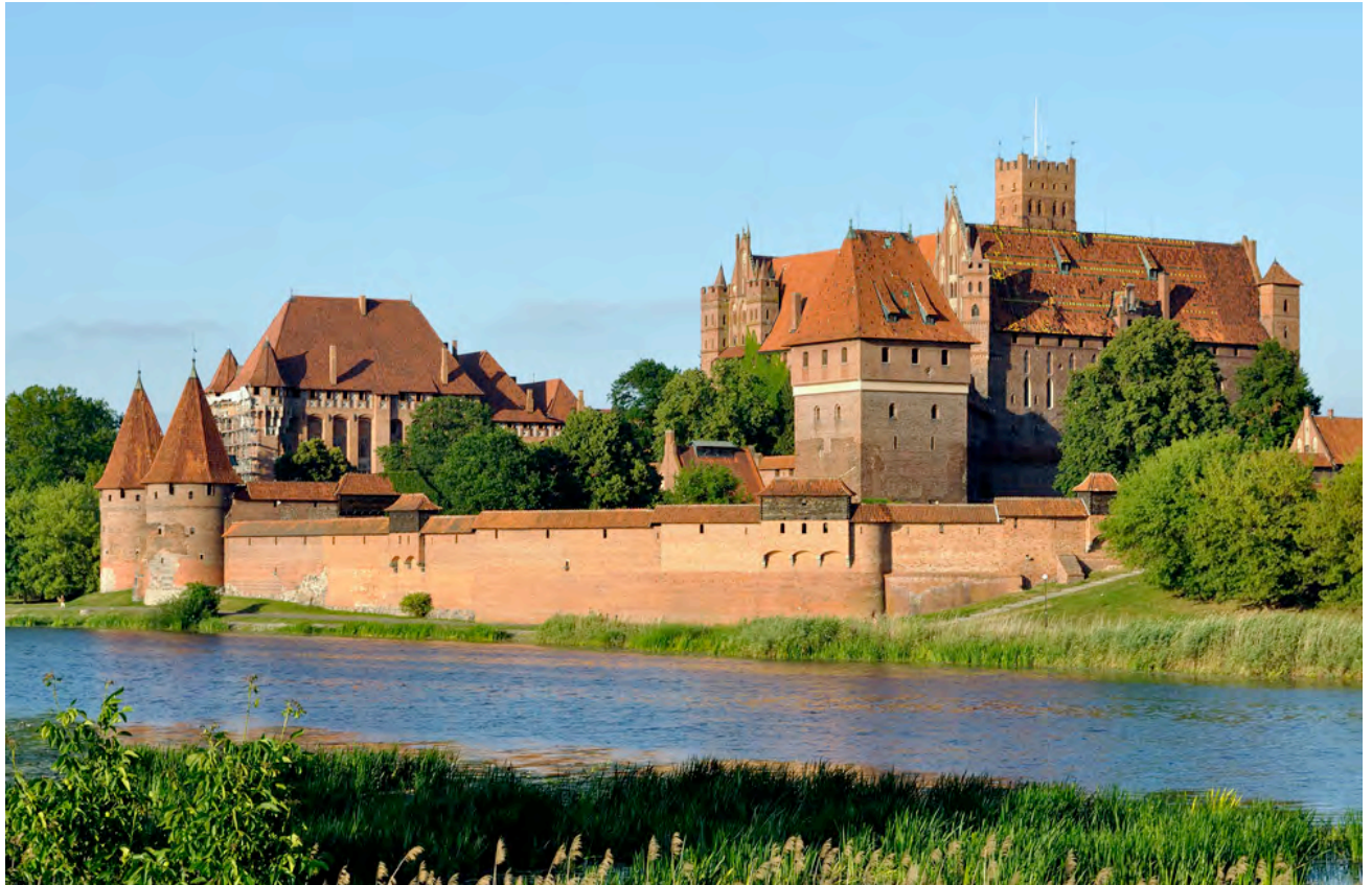
Le château de Malbork qui fut le quartier général de Lannes et d'Oudinot en 1807

Visite guidée du Château de l'ordre Teutonique de Malbork , le plus grand château médiéval d'Europe, siège du grand-maître de l'ordre et de la capitale de l'Etat conventuel de 1309 à 1466.