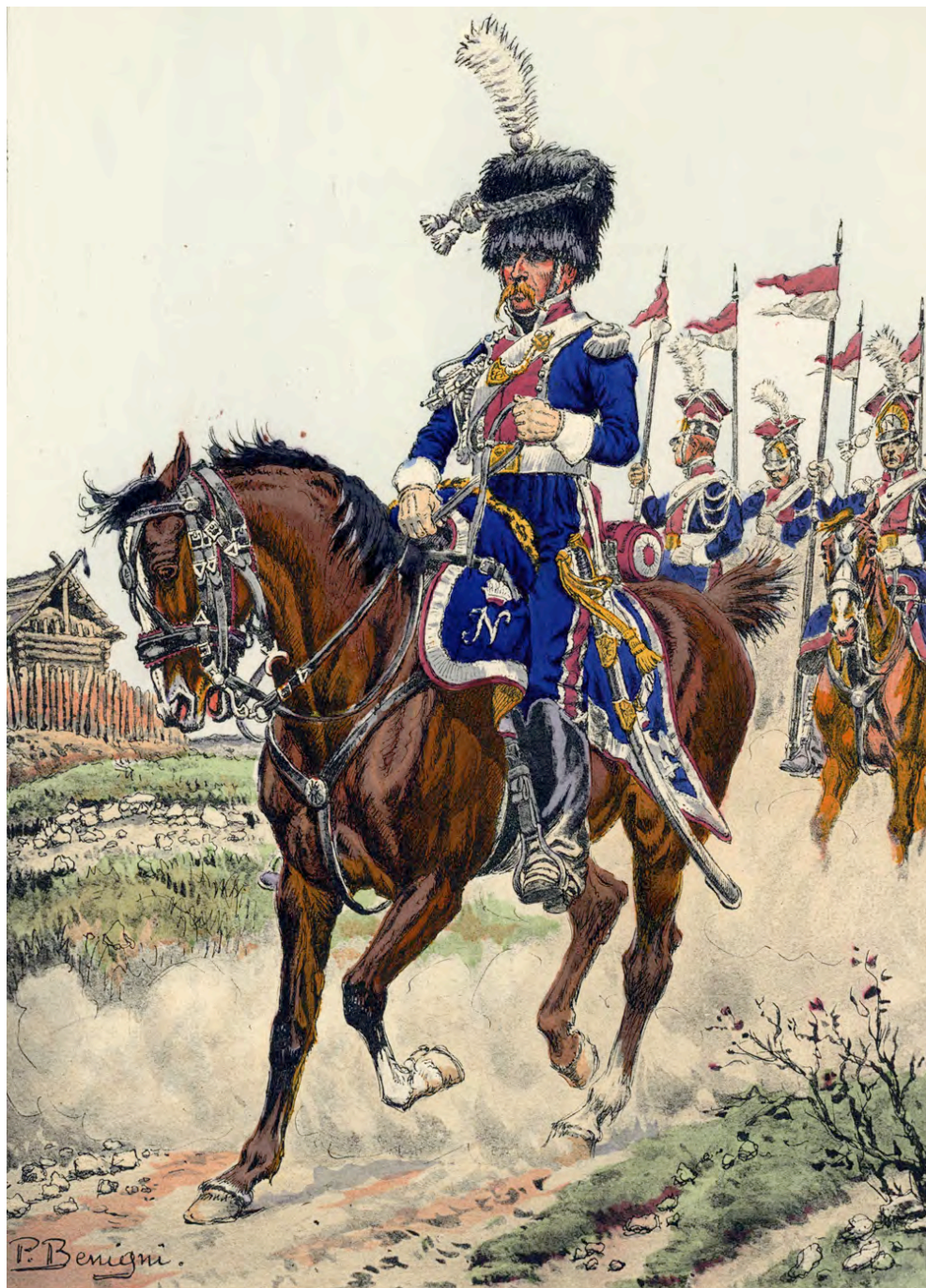
Lanciers polonais de la Garde impériale

Dîner et nuit à l'hôtel Mercure Krakow Stare Miasto 4* à Cracovie.