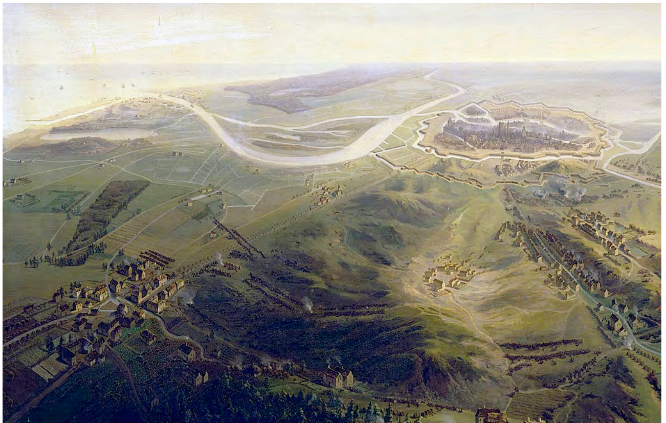
Siège de Dantzig en 1807, par Siméon Fort

A l'arrivée, accueil par votre guide francophone et transfert au centre-ville de Gdansk. La ville fut assiégée par le maréchal Lefebvre le 1 er avril 1807 et prise le 24 mai avec l'aide de Lannes et d'Oudinot. Ce dernier y séjourna avec ses grenadiers du 15 juillet 1807 au 5 mars 1808. A la fin de l'année 1812, Napoléon envoya le général Rapp prendre le commandement de Dantzig, qui fut assiégée le 21 janvier 1813 et capitula le 29 novembre.