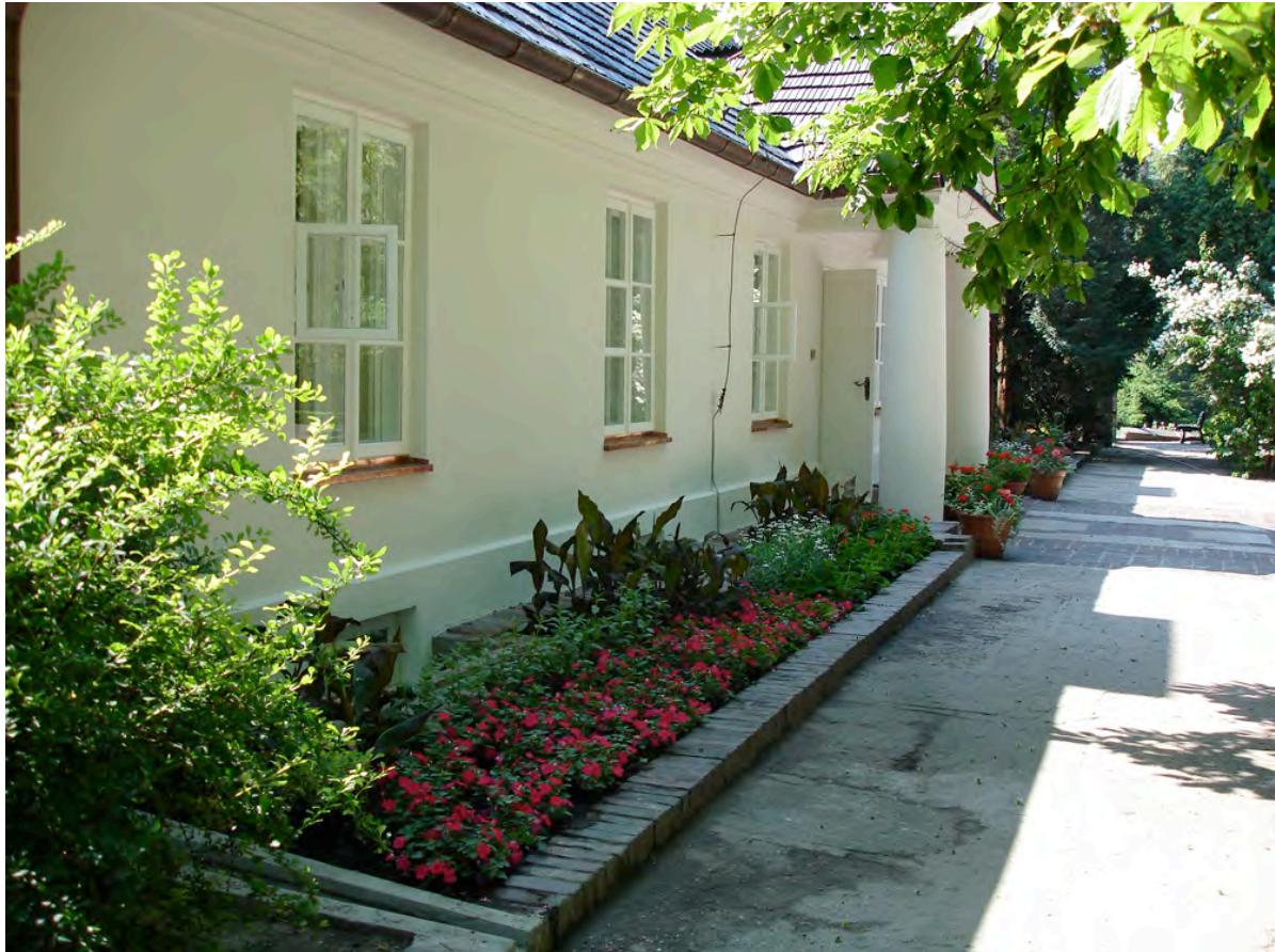
Maison natale de Frédéric Chopin à Żelazowa Wola

Visite guidée de la Maison natale de Frédéric Chopin , important lieu de pèlerinage pour les amoureux de la musique du célèbre pianiste et compositeur polonais.