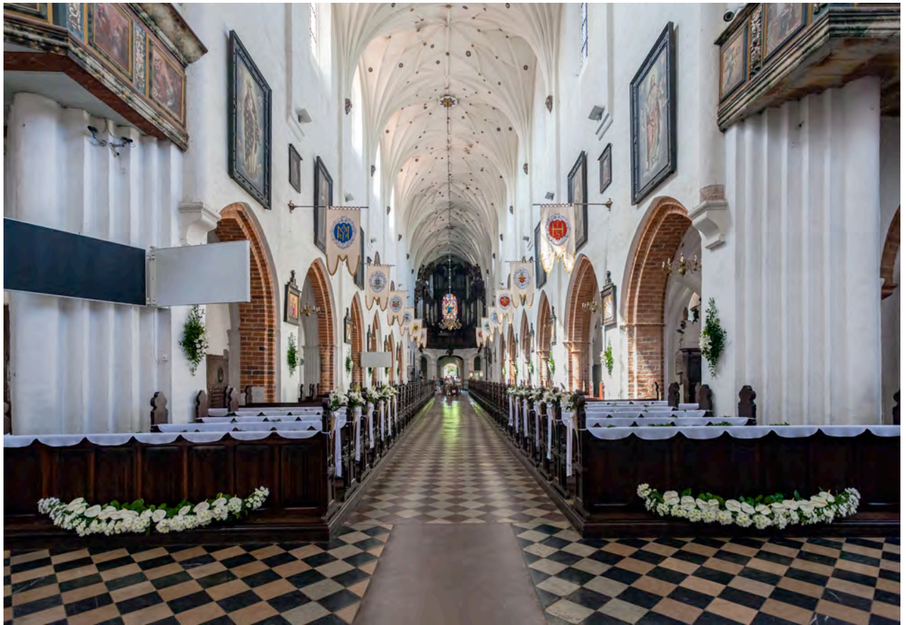
La nef de la cathédrale d'Oliwa

Découverte guidée de la vieille ville de Gdańsk, dont l'âge d'or se situe à l'époque où la ville faisait partie de la Ligue hanséatique.