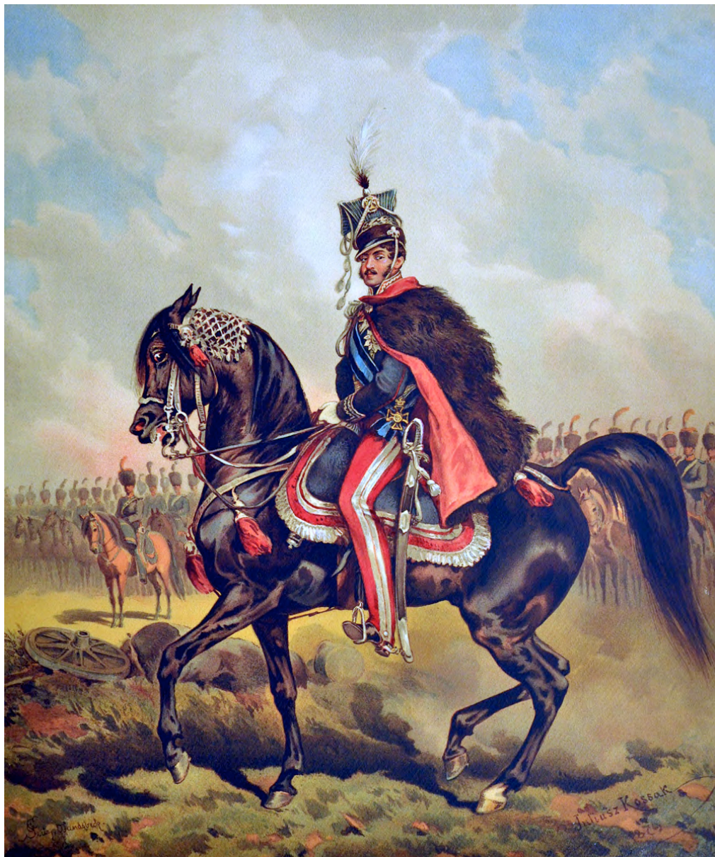
Le maréchal Poniatowski